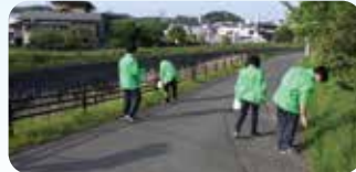
社会貢献活動「ゴミ拾い活動」